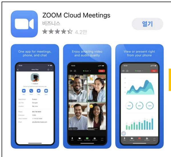
어플 다운로드 후 실행